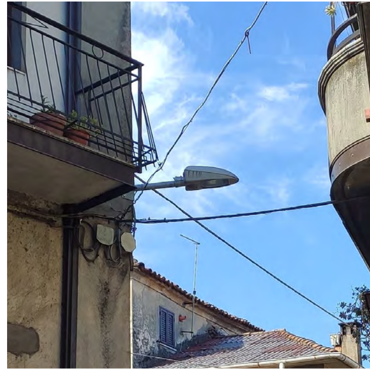
RICOGNIZIONE FOTGRAFICA DEI CORPI ILLUMINANTI ESISTENTI